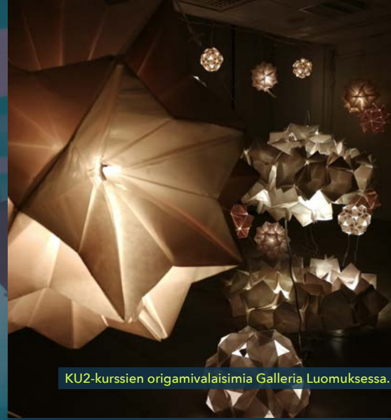
KU2-kurssien origamivalaisimia Galleria Luomuksessa.