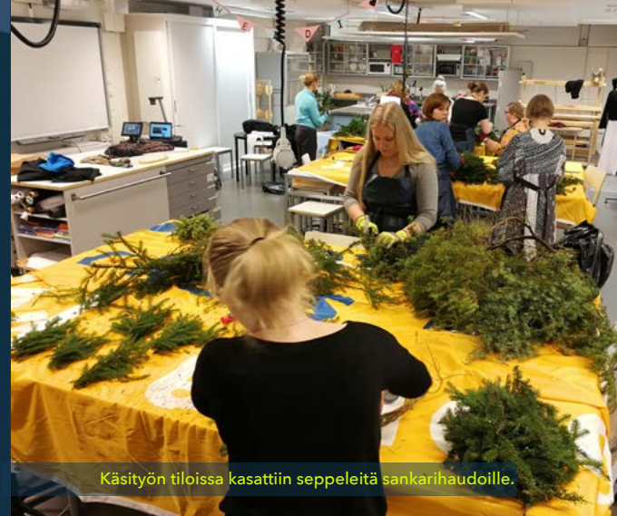
Käsityön tiloissa kasattiin seppeleitä sankarihaudoille.