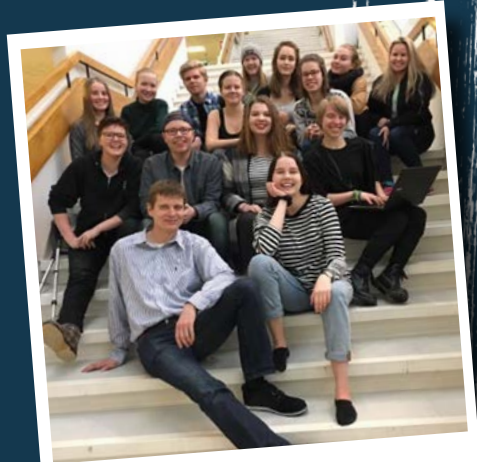
Tällä porukalla puuhailtiin vuosi 2017 yhdessä.

Opiskelijakunnan hallitus on aheranut vanhalla tutulla pöhinällä uusien ja jo perinteiksikin muodostuneiden tapahtumien parissa. Vuoteen 2017 mahtui merkkipaaluja, kuten Suomen 100-vuotisjuhlapäivä sekä teemaviikkoja. Tapahtumien lisäksi hallitus kokousti vuoden aikana yhteensä 18 kertaa ja pyrki parhaansa mukaan saamaan kaikkien opiskelijoiden äänet kuuluviin mm. järjestämällä luottamusopiskelijoiden suurenkokouksia. Tammikuussa 2018 järjestettiin uudet vaalit, jonka jälkeen hallitustoimintaa on pyörittänyt uusi kokoonpano.