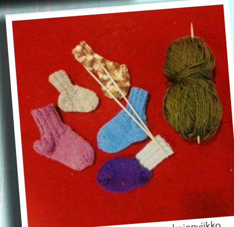
13-17.11. perinteinen #hyvientekojenviikko täynnä toimintaa: mm. vierailu Lahdensivun vanhainkotiin, SPR: verenluovutus- ja kantasoluinto sekä jälkkäribuffet.