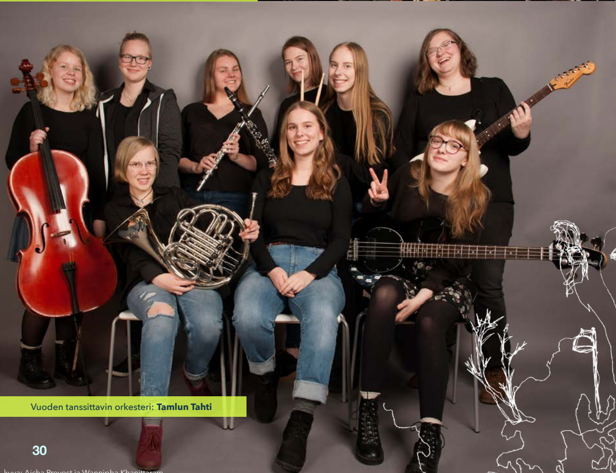
Vuoden tanssittavin orkesteri: Tamlun Tahti