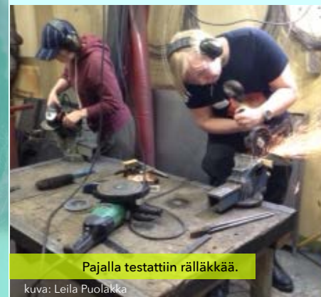
Pajalla testattiin räälläkkää.