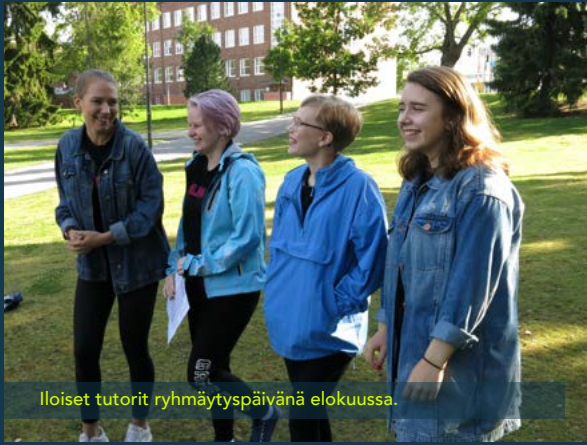
Iloiset tutorit ryhmäytyspäivänä elokuussa.