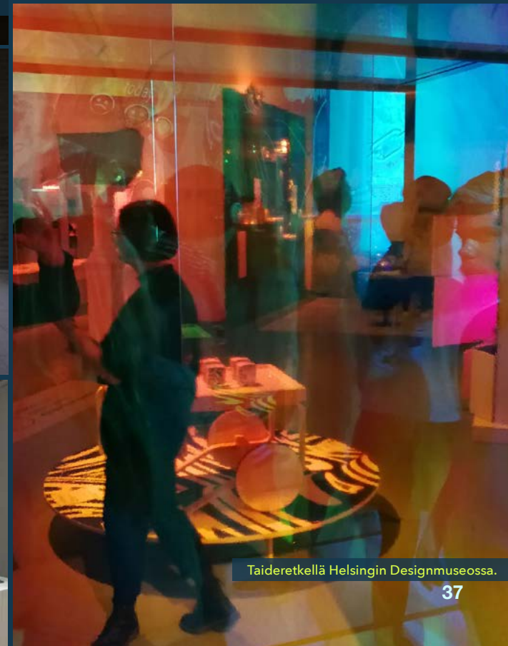
Taideretkellä Helsingin Designmuseossa.