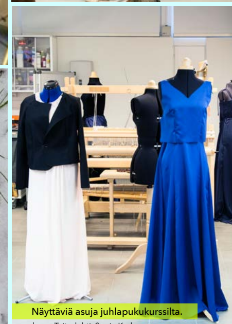
Näyttäviä asuja juhlapukukurssilta.