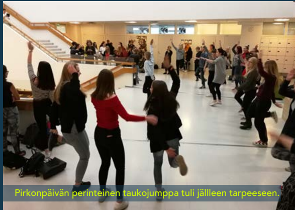
Pirkonpäivän perinteinen taukojumppa tuli jälleen tarpeeseen.