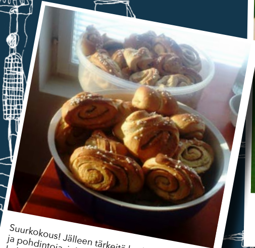
Suurenkokous! Jälleen tärkeitä keskustelunaiheita ja pohdintoja, joita saatiin yhdessä mietiskellä kokouseväiden äärellä. #suurenkokous