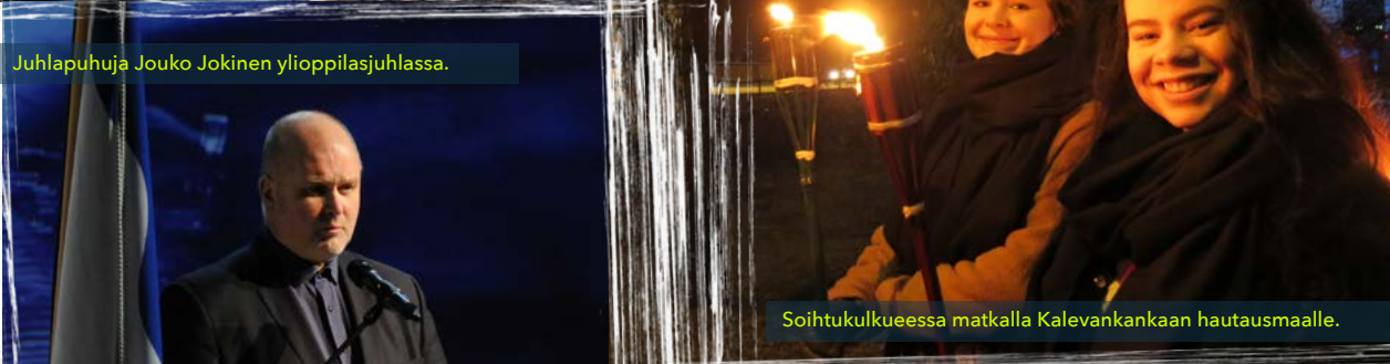
Soihtukulkueessa matkalla Kalevankankaan hautausmaalle.