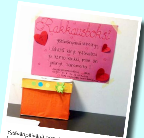
Ystävänpäivänä poppi soi, karkkeja syötiin ja kauniit sanat kiisivät kavereille! #yp