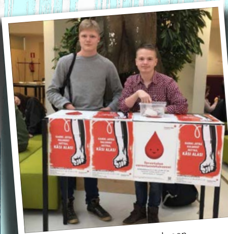
Luovuttakaa jo! Tamlu sai onnekseen verenluovutusmahdollisuuden ihan kouluun asti. Kyllä taas veri kiertää! #spr #verenluovutus