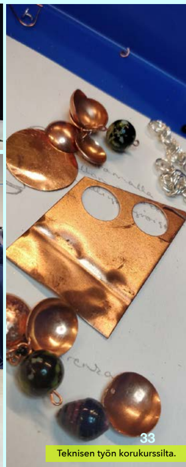
Teknisen työn korukurssilta.