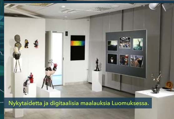
Nykytaidetta ja digitaalisia maalauksia Luomuksessa.