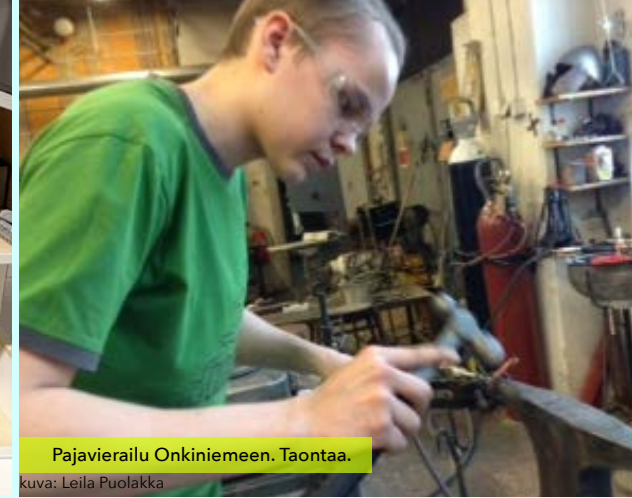
Pajavierailu Onkiniemeen. Taontaa.