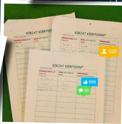
Mikäs se tämä...? Kirjakirppislistahan se! Onko hallitus siis elvyttämässä Tameran? #kirjatkiertoon