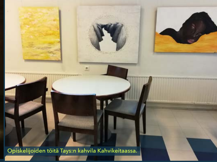
Opiskelijoiden töitä Tays:n kahvila Kahvikeitaassa.