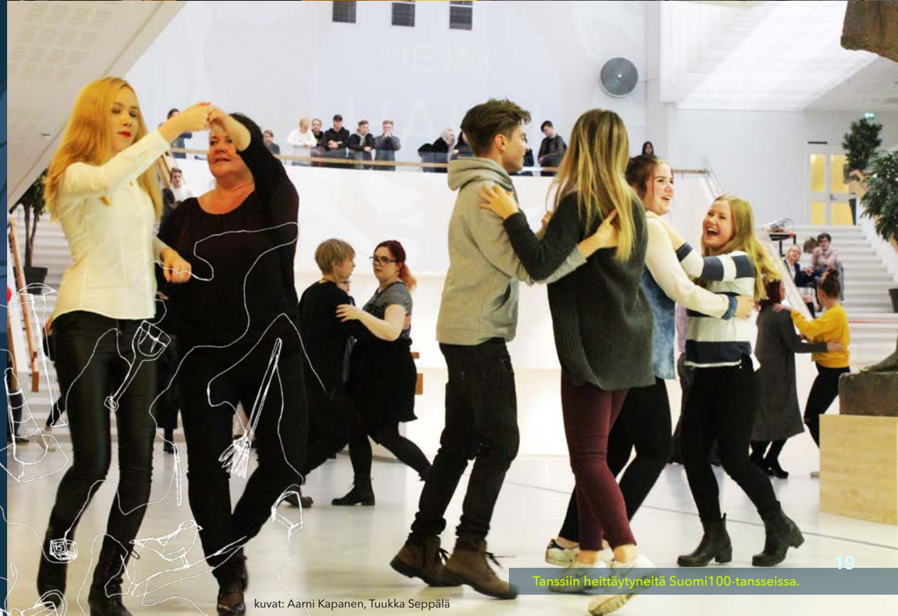
Tanssiin heittäytyneitä Suomi100-tansseissa.