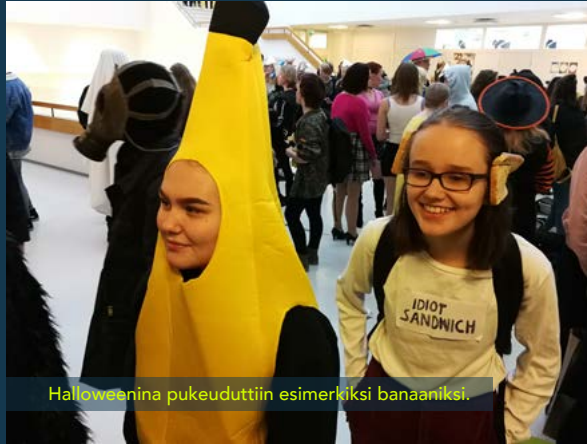
Halloweenina pukeuduttiin esimerkiksi banaaniksi.