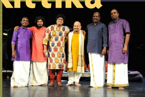
Elokuussa Tamlussa vieraili intialaisen taidemusiikin orkesteri mRittika maailmankiertueellaan.