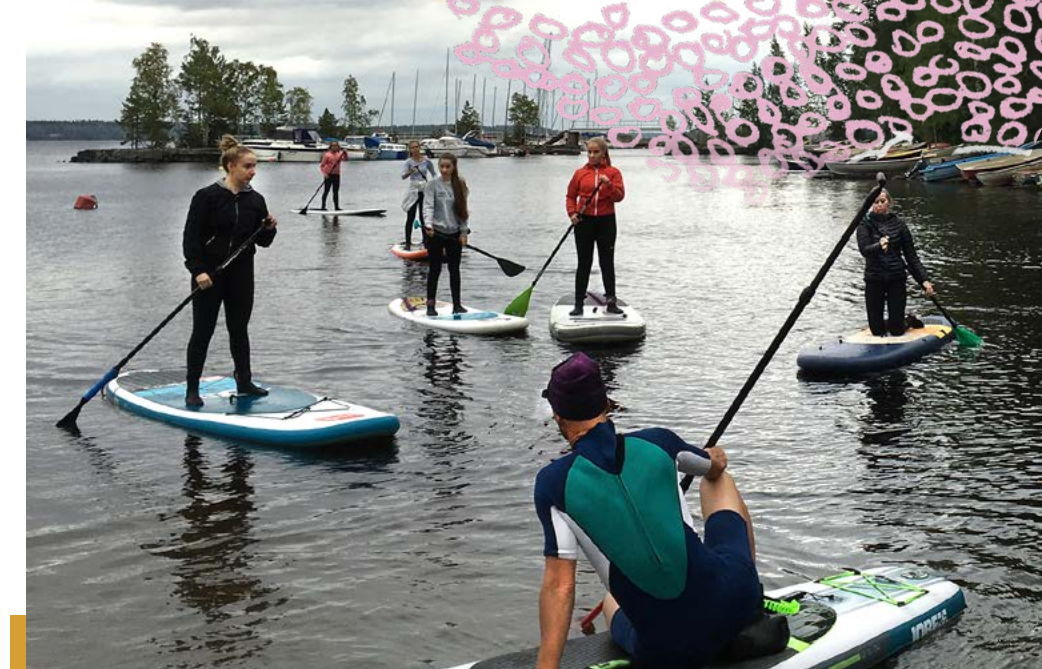
Liikuntakurssilaiset harjoittelevat suppausta Rauhaniemen rannassa.