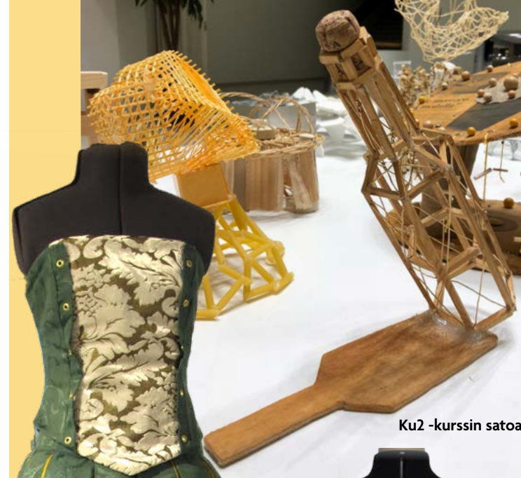
Ku2 -kurssin satoa