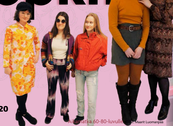
Aikamatka 60-80-luvulle.