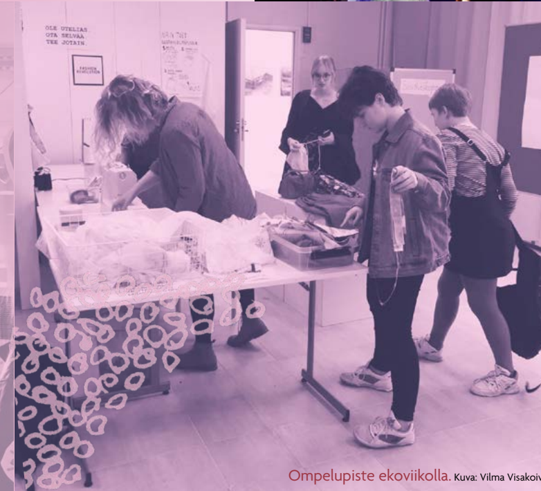
Ompelupiste ekoviikolla.